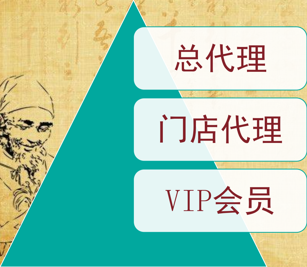
代理——零售收益一览表