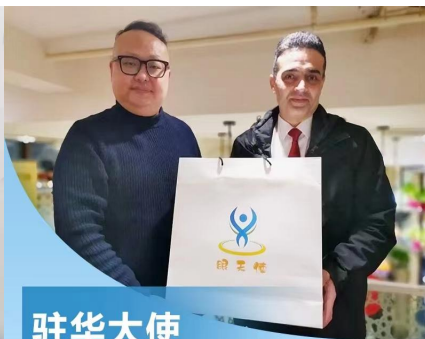
驻华大使 使用同款护眼贴