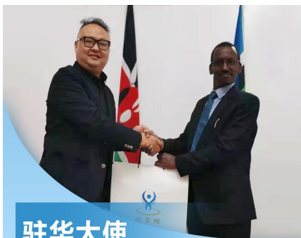
驻华大使 使用同款护眼产品套盒