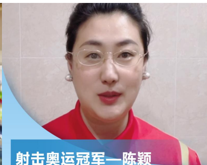
射击奥运冠军—陈颖 为秦龙点赞