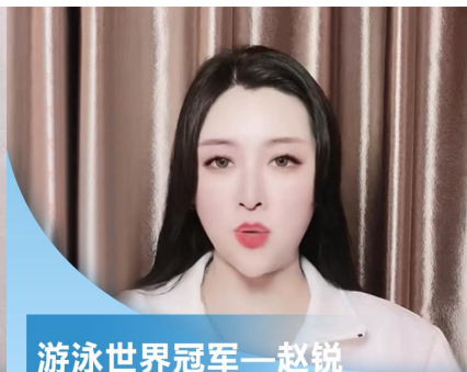
游泳世界冠军—赵锐 为秦龙点赞